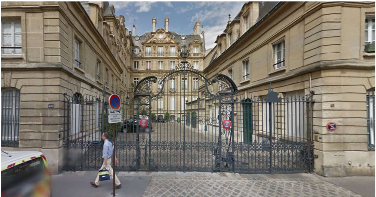
Rue Barbet de Jouy, Paris