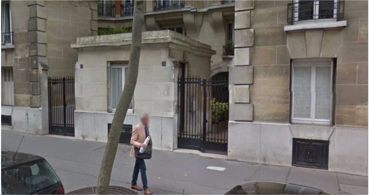
Rue Chardon-Lagache, Paris